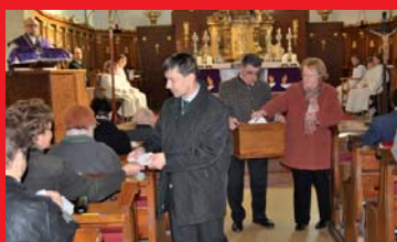
PGR-Wahl, S. 6