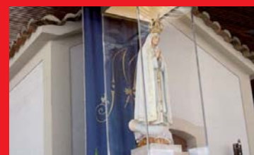
Fatima-Pilgerreise, S. 11