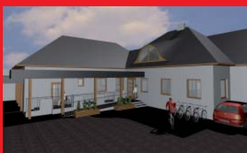
Pfarrhofumbau, S. 8